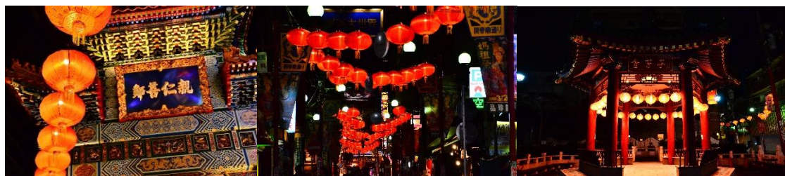
横浜中華街の象徴 善隣門