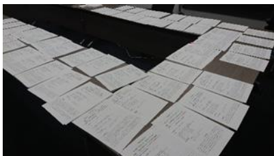
（エントリーされた企画案）

69チームから提案された企画を、「イノベーション」「説得力」「実現可能性」「社会的意義」「プレゼンテーション」の、5つの採点指標に基づき、関東学院大学・オブザーバーの三菱UFJ銀行横浜支店・横浜中華街がそれぞれ採点。協議の末、32チームが最終選考会に進みました。