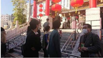
（フィールドワークの様子）

学生たちが実際に横浜中華街に行き、どんな企画が提案できるか考えました。何度も街に足を運ぶ学生や、他の中華街も知るべきだと神戸・南京町まで行った学生もいるなど、皆とても意欲的でした。