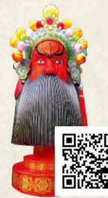
かんう うんちょう 関羽 雲長