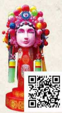
ぼくけいえい 穆桂英