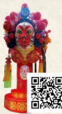
そん ごくう 孫悟空