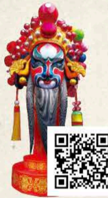
しょうりけん 鐘離権