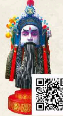
りゅうびげんとく 劉備 玄德