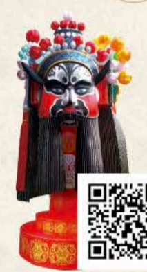
ちょうひ えぎとく 張飛 益徳